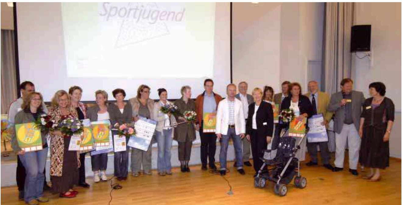
Offizielle Übergabe der ersten „Gütesiegel Bewegungskita“ im Mai 2007

Zusätzlich zu den Ausführungen in diesem Handlungsrahmen werden Möglichkeiten der Unterstützung (zum Beispiel durch Fortbildung) zu verschiedenen Aspekten der psychomotorisch orientierten Erziehung angeboten, um das Wissen und das Handlungsrepertoire in der Bewegungserziehung zu erweitern.