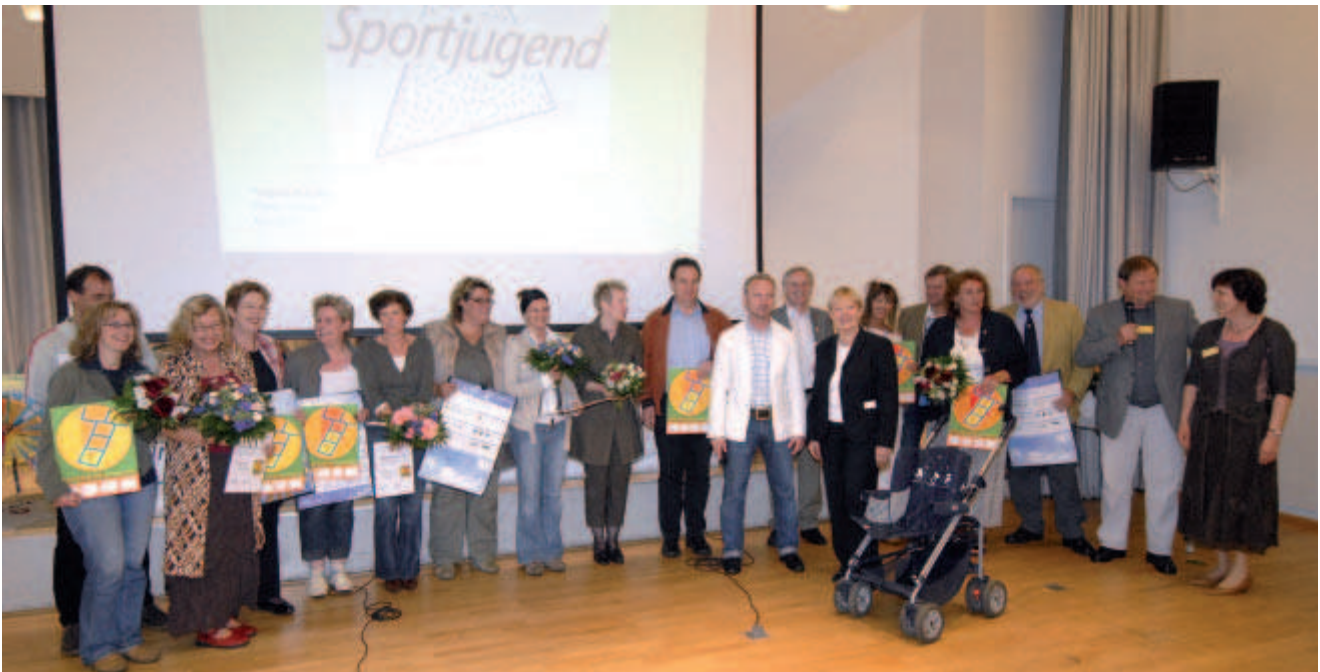
Offizielle Übergabe der ersten „Gütesiegel Bewegungskita“ im Mai 2007

Zusätzlich zu den Ausführungen in diesem Handlungsrahmen werden Möglichkeiten der Unterstützung (zum Beispiel durch Fortbildung) zu verschiedenen Aspekten der psychomotorisch orientierten Erziehung angeboten, um das Wissen und das Handlungsrepertoire in der Bewegungserziehung zu erweitern.